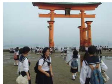
宮島の大鳥居に感動

9月11日（水）から、2泊3日で山口・広島方面へ行ってきました。初めてのコースでもあり、心配な点もありましたが、天候にも恵まれ、楽しく有意義な旅行となりました。萩では、レンタサイクルで市内を巡り、歴史と文化の香る街並みを肌で感じることができました。秋吉台・秋芳洞では、大自然の雄大さを感じられたと思います。また広島の平和資料館では、原爆の悲惨さや平和の大切さをしっかりと胸に刻めたことと思います。