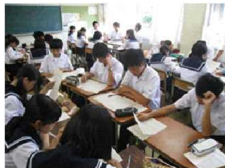
職場訪問研究発表会の様子

苦しみながらも頑張りを続ける子どもたちを見てみると、保護者の方が見えなくなることもあると思います。しかし、3年間、最後まで頑張りを続けることの意義を御理解いただき、応援をお願いしたいと思います。