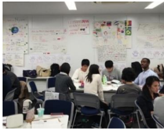
ディスカッション (イメージ)

ISAとしての基本的な対策は、ホームページに掲載しております。本プログラムでも、この内容で実施します。バーコードを読み取り、ご確認ください。